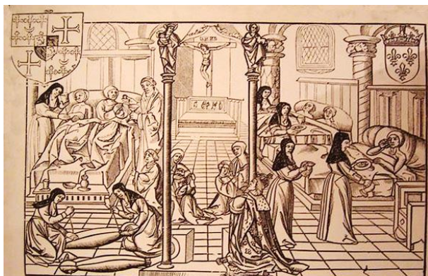
Fig. 44. — Une salle de l'Hôtel-Dieu de Paris. Fac-similé d'une gravure sur bois, du seizième siècle, en tête d'un registre manuscrit, intitulé : Le Pardon, grâces et facultés octroyés à Monseigneur l'archevêque patriarche de Bourges et primate d'Aquitaine, aux bienfaiteurs de l'Hostel-Dieu de Paris. Biblioth.

Il existe d'ailleurs un autre point commun entre ces deux grands hommes que furent Vésale et Paré : nul ne sait où sont leurs sépultures. Vésale mourut sur l'île grecque de Zante, au retour d'un pèlerinage en Terre Sainte, en 1564. L'église où reposait son corps fut détruite par un tremblement de terre. Quant à la tombe d'Ambroise Paré, qui fut enseveli à Paris, elle disparut également, peut-être dans la tourmente révolutionnaire.