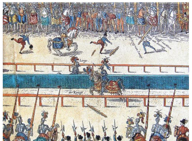
Henri II blessé lors d'un tournoi

Ainsi, les événements personnels de la vie de Vésale ont croisé les vicissitudes de la grande histoire de la Renaissance. De même, qu'ils ont croisé le destin de l'autre génie de la médecine que fut Paré, le chirurgien le plus brillant de son époque.