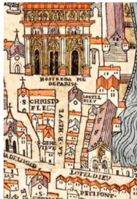
L'Hôtel Dieu en 1550