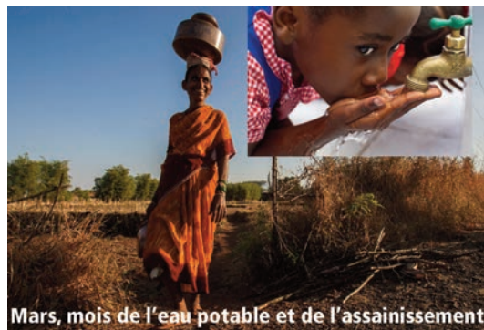
Mars, mois de l'eau potable et de l'assainissement

LES ROTARIENS Des gens ordinaires qui, ensemble, réalisent des choses extraordinaires.